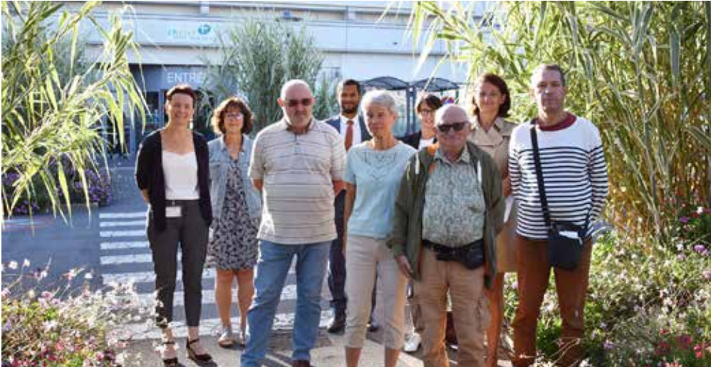
La semaine d'information sur la santé mentale est orchestrée par un collectif rassemblant professionnels, usagers et familles d'usagers.

Les semaines d'information sur la santé mentale visent à sensibiliser, prévenir et rassembler, en proposant différents temps forts.