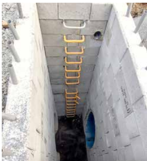
Agglom ration du Choletais

Les tranch es pourront atteindre 6 m de profondeur pour y poser certains ouvrages.