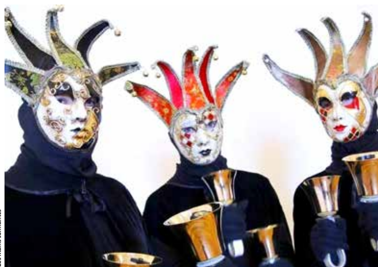
Le groupe les Mains sonnantes se produira au Sacré-Cœur dans le cadre des journées nationales du carillon.

Le dimanche, un carillon ambulant se déplacera autour de l'église Notre-Dame et sur la place Travot. L'après-midi, c'est au Sacré-Cœur à nouveau que se poursuivront les festivités: visite du carillon de 14 h à 17 h 30, puis concert du groupe de handbells (cloches à mains) les Mains sonnantes, à 18 h.