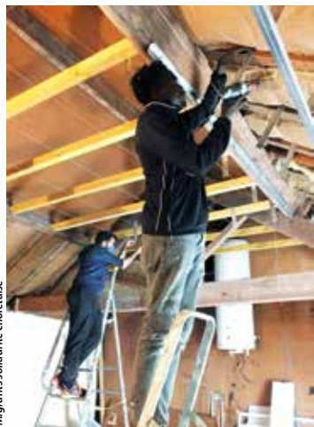
Migrants solidarité choletaise

Sept familles aidées Surtout, l'association a développé un système pour les héberger : le 100 pour un. « Si 100 personnes s'engagent à donner minimum 5 € par mois, pendant au moins deux ans, nous arrivons à collecter le montant d'un loyer. Sachant que la majorité des adhérents donnent plus, avec une défiscalisation possible, nous pouvons aujourd'hui louer quatre logements. Les migrants participent quand ils le peuvent. Nous logeons également trois familles, à Trémentines, dans une longère que nous avons entièrement réhabilitée et que le propriétaire nous met à disposition pendant dix ans. » Après des mois de travaux d'électricité, de plomberie, de chauffage, d'isolation, d'huissieries, etc., 11 personnes, dont trois bébés qui y sont nés depuis, peuvent aujourd'hui bénéficier de cet endroit paisible. Le territoire ne disposant pas d'hébergement