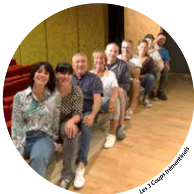
Les 3 Coups trémentinai

L'association les 3 Coups trémentinai est repartie sur les planches pour présenter sa nouvelle pièce, 2,20 euros, de Marc Fayet.