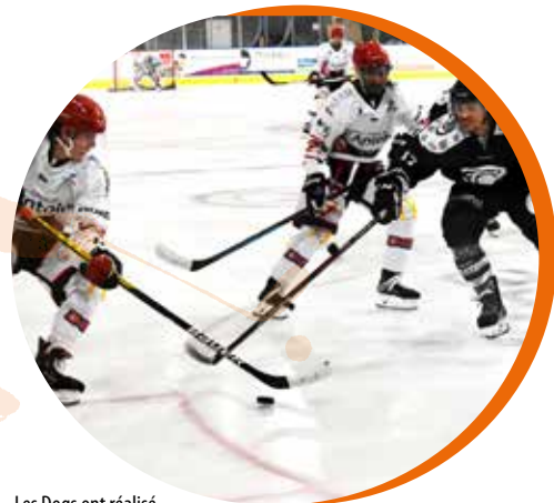
Les Dogs ont réalisé une bonne pré-saison.

Finalistes de Division 1 l'an dernier, les hockeyeurs choletais ont généré attente et convoitises. Contraints à de multiples changements, ils restent confiants.