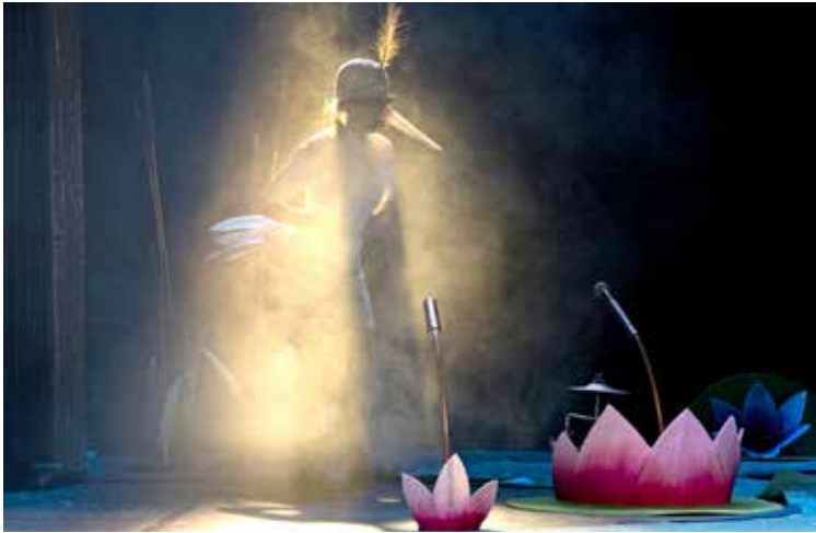
Les Fables reprennent les travers des hommes que Jean de La Fontaine décrivait et dénonçait dans ses œuvres, avec humour et fantaisie.

Le théâtre Saint-Louis propose un spectacle coup de cœur avec Les Fables , par l'Agence de Voyages Imaginaires, d'après Jean de La Fontaine. Drôle et truculent à la fois, il est à découvrir ces jeudi 6 et vendredi 7 octobre, à 20 h 30. Il commencera dans le hall d'accueil par La fête de la cigale... « Le chemin de la compagnie Agence de Voyages Imaginaires a toujours été d'éveiller les spectateurs, de leur donner des ailes. Reconnaisant cet engagement et ces valeurs chez Jean de La Fontaine, nous avons plongé dans ces 246 fables ! Quelle n'a été notre stupéfaction en y retrouvant un