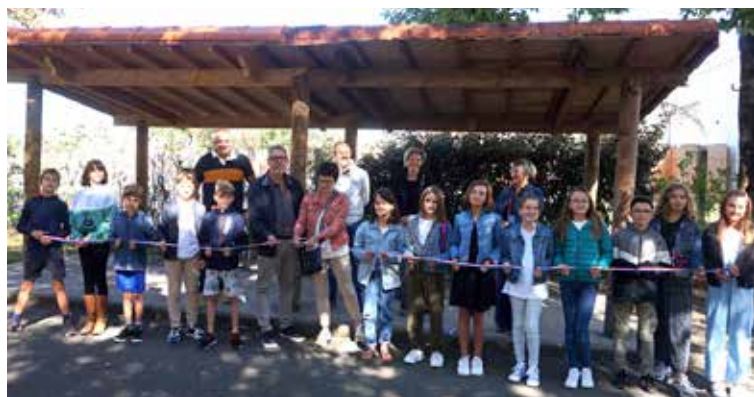
Mairie de Saint-L ger-sous-Cholet

ou en trottinette. Ils ont donc fait une demande d'agrandissement de cet abri aupr s de la commission Cadre de vie, qui a retenu le projet. Le souhait des  lus  tait de concevoir une extension utilisant le m me type de bois et de tuiles pour l'harmonie de cette construction. Cet abri est op rationnel depuis la rentr e scolaire.