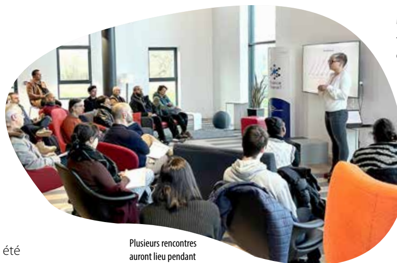
Plusieurs rencontres auront lieu pendant cinq jours.

En 2023, près de 1300 entreprises ont été créées sur le Choletais, pas moins de 10000 en Maine-et-Loire. Un forum de la création reprise d'entreprise se déroulera le mercredi 16 octobre, de 14 h à 18 h, à la Filature numérique. Une quarantaine de structures de l'accompagnement et du financement de la création reprise d'entreprise sera présent pour répondre à toutes les questions.