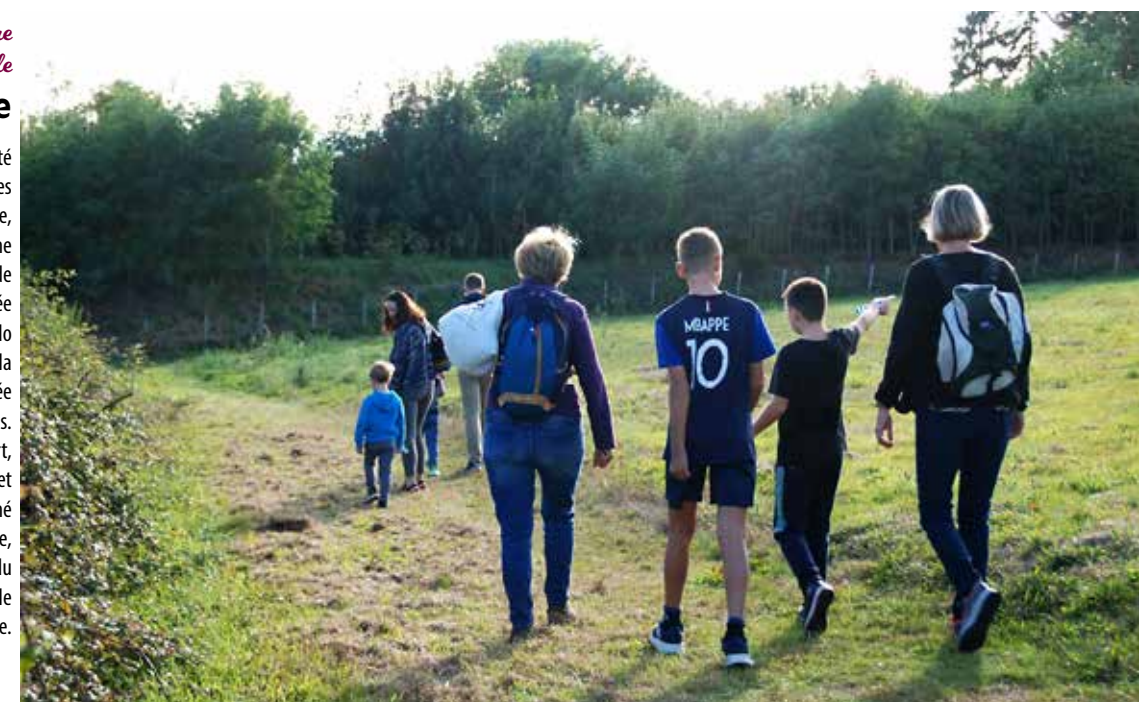
Mairie de Toutlemonde

Les marcheurs ont profité des belles lumières de début de soirée, tombant sur la campagne environnante, lors de la randonnée portée par l'association Zoodo Toutlemonde Yargo et la Municipalité, ponctuée d'étapes gourmandes. Après l'effort, le réconfort, c'est bien connu! Petits et grands ont ainsi terminé la journée en musique, avec la prestation du groupe Phenix, dans le jardin du presbytère.