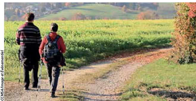
Cette journée propose d'échanger avec des acteurs du monde agricole, au gré d'une randonnée reliant différentes exploitations.

Dons: https://www.helloasso.com/associations/upupa