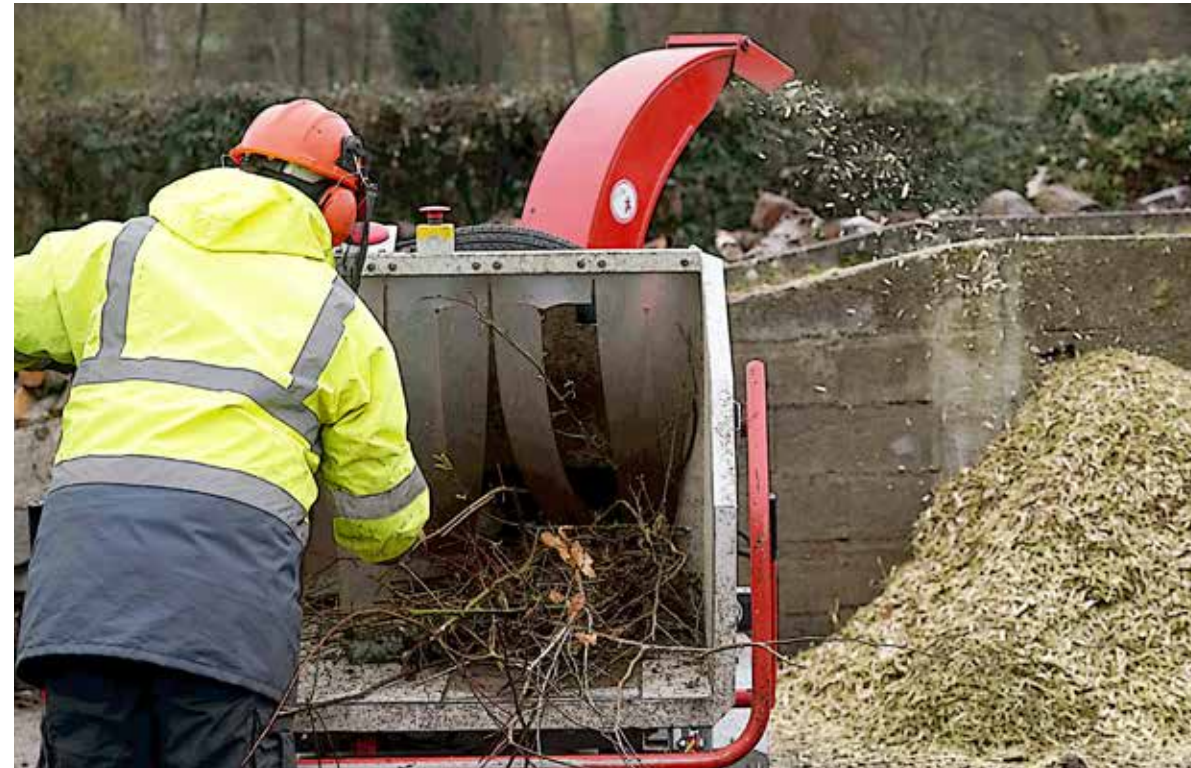
Le broyage vous intéresse? Un guide spécifique est disponible en téléchargement sur cholet.fr.