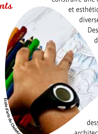
École d'arts du Choletais

La pratique artistique stimule la créativité et l'imagination des enfants, favorise l'expression personnelle et la confiance en soi, tout en développant le sens esthétique et la pensée critique. À travers l'enseignement proposé, les enfants abordent de multiples approches et techniques et découvrent des artistes et leur univers. Les enfants de 7-8 ans peuvent encore intégrer le cours pluridisciplinaire, et ceux de 11 à 13 ans, le cours dessin couleur et celui d'architecture.