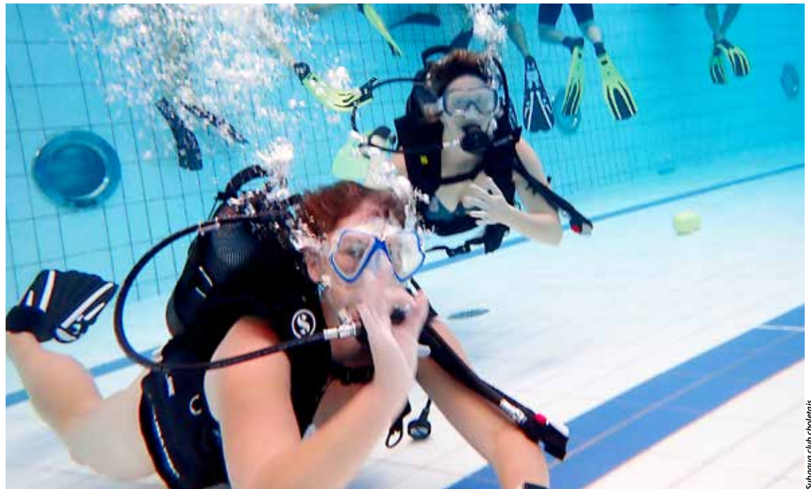
Subaqua club choletais

Escalade, plongée, yoga, karaté, volley-ball, cyclisme, hockey sur glace, badminton, gymnastique, capoeira, rugby... Il était impossible de ne pas trouver son bonheur pour se dépenser et s'amuser lors de l'événement Sport en famille. Enfants et parents ou grands-parents étaient invités par l'Office municipal du sport et ses clubs partenaires pour des initiations gratuites, idéales pour choisir une activité en cette rentrée.