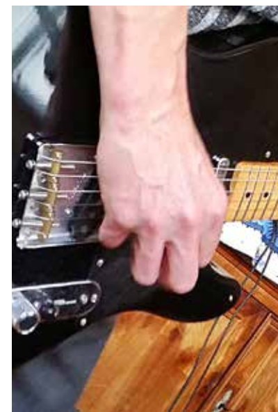
L'ambiance sera assurément rock, ce samedi 5 octobre, pour le concert de Nightfall à Interlude.

Le groupe choletais Nightfall fête son anniversaire au théâtre Interlude . D'abord créé dans les années 70, il s'est reformé en 2009, après plus de 20 ans d'absence. Depuis, le groupe, composé de deux guitaristes, un bassiste, un batteur, un saxophoniste/harmoniciste et un chanteur, distille sur scène son énergie électrique dans une ambiance pop-rock. Son répertoire composé de reprises de grands standards (Rolling Stones, Status Quo, U2, Queen, etc.) est à retrouver ce samedi 5 octobre, à 20 h 30 au théâtre Interlude.