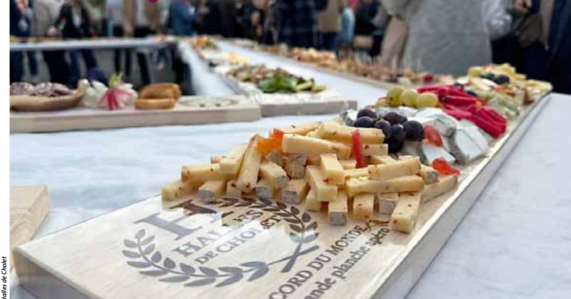
Halles de Cholet