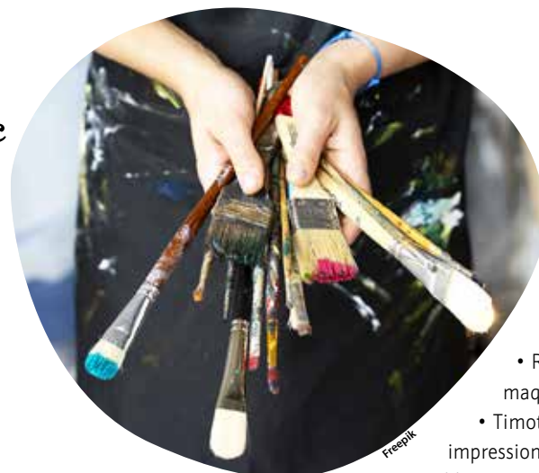
L'exposition est présentée ces samedi 5 et dimanche 6 octobre.