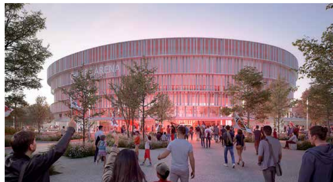
Chabanne architecte, Grégoire architectes, AER studio et Cholet Agglomération

Des espaces sportifs, d'autres dédiés au club résident (administration et centre d'entraînement) et des salles médias compléteront ce projet biosourcé, modèle d'exemplarité en termes d'approche environnementale. « Les lignes courbes, en plus de faire écho à l'histoire textile de la Ville de Cholet avec les trames verticales, permettent à cet équipement d'être le plus performant possible, en optimisant les surfaces déperditives sur le volume à chauffer. La chaufferie bois couvrira l'intégralité des besoins de chaleur du bâtiment de 13 523 m 2 ,