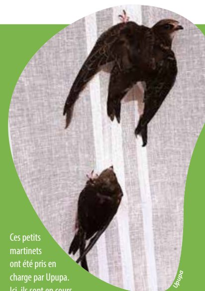
Ces petits martinets ont été pris en charge par Upupa. Ici, ils sont en cours d'entraînement au vol, en vue de les relâcher.