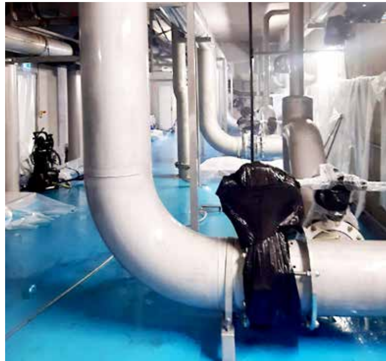
Service Eau potable - Direction de l'Environnement - Cholet Agglomération

Les canalisations de l'usine de production d'eau potable de Ribou ont fait l'objet d'un nettoyage approfondi, accompagné d'une passivation, redonnant à l'inox sa protection.