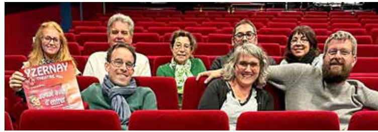
Compagnie du Brême

Les acteurs seront bientôt sur les planches, laissant les fauteuils rouges aux spectateurs.