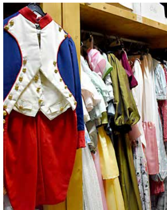
Plus de 15 000 costumes et accessoires garnissent les armoires de l'Envers du décor.

Une soixantaine de costumes sont également confectionnés et enrichissent la collection grâce aux doigts de fée d'une couturière, Amélie Brunet, l'une des quatre autres salariés de l'association, rebaptisée St-Paul Art'Scène l'an dernier.