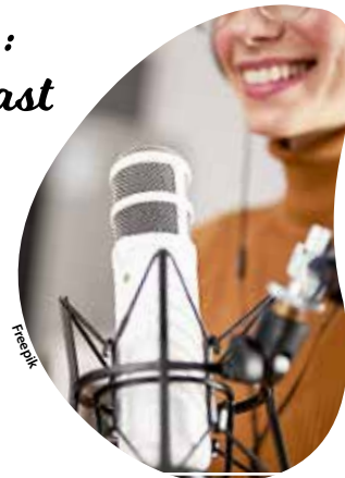
Des séances d'enregistrement de podcasts sont organisées pour aider les femmes en recherche d'emploi.

Les prochaines dates de ce cycle, auquel il est toujours possible de participer, se tiennent les mardis