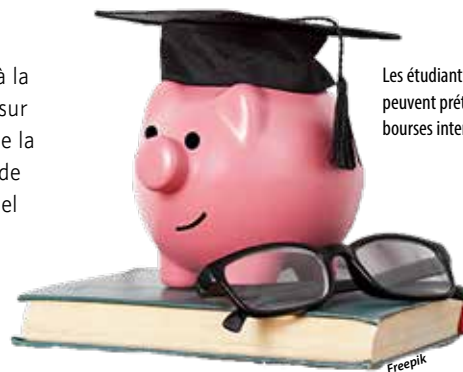
Les étudiants choletais peuvent prétendre à trois bourses intercommunales.

La bourse intercommunale pour stage ou séjour académique à l'étranger Cholet Agglomération attribue une aide de 300 € pour un séjour d'au minimum huit semaines consécutives d'un jeune dont la famille réside dans l'une des communes de Cholet Agglomération et qui est en formation initiale (jusqu'au bac + 3). Le nombre de bourses est limité à 40 par année civile, par ordre de réception des dossiers complétés, selon la