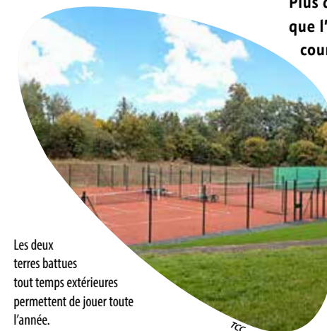
Les deux terres battues tout temps extérieures permettent de jouer toute l'année.