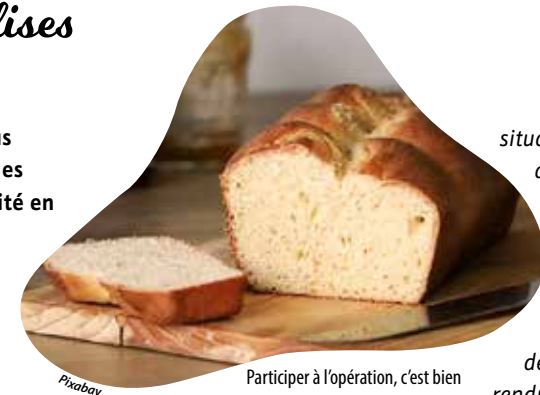
Participer à l'opération, c'est bien plus que l'achat d'une brioche !

Et si régaler vos papilles vous permettait de contribuer à des actions concrètes de proximité en faveur d'adultes déficients ? C'est la promesse de l'opération brioches menée par l'Association des parents amis et adultes en situation de handicap de la région choletaise (Apahrc). De ce jeudi 17 au samedi 19 octobre, des dizaines de bénévoles donneront de leur temps pour participer à la vente de ces viennoiseries dans une dizaine de magasins, dont six de l'agglomération, à leurs horaires d'ouverture : Intermarché Cholet Moine et Cholet Marne, Intermarché Le May-sur-Èvre, Leclerc