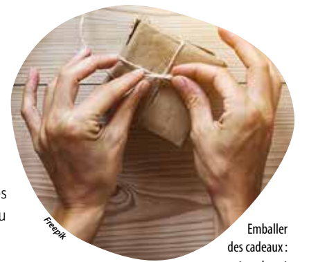
Emballer des cadeaux : un geste qui peut être solidaire !