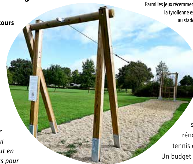
Parmi les jeux récemment installés, la tyrolienne est à retrouver au stade.

Se laisser glisser sur une tyrolienne, explorer un parcours d'équilibre, se balancer dans un nid d'oiseau ou se hisser sur un filet de grimpe... Avec les nouvelles structures de jeux, installées au stade, dans les lotissements ou en bord de rivière, les enfants âgés de 3 à 14 ans ont le choix pour leurs activités en extérieur. « Nous souhaitons remplacer les structures vieillissantes qui existaient précédemment, tout en proposant des aménagements pour chaque âge et en étant à l'écoute des demandes formulées par les premiers intéressés » détaille Dolorée Coulonnier, adjointe en charge de la Vie sociale. De plus, la Municipalité a remis