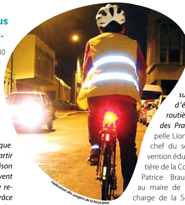
Éclairage et éléments réfléchissants sont un combo indispensable pour être vu la nuit à vélo, à trottinette ou à pied.

« Entre 17 h et 19 h, fin octobre, on sait que l'on connaîtra un pic d'accidentalité. À partir de cette période et pendant toute la saison hivernale, les usagers non carrossés doivent donc être encore plus attentifs à se faire remarquer. Il leur faut se rendre visibles grâce à l'éclairage de leur engin, mais aussi par des vêtements clairs et des éléments réfléchissants comme les brassards offerts aux 1 800 élèves d'écoles primaires de l'agglomération, venant chaque année suivre le cycle d'apprentissage