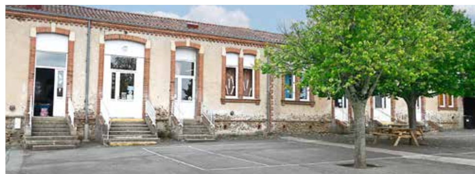
L'école élémentaire compte 146 enfants, répartis dans six classes, qui vont toutes être rénovées.

Dons : par chèque à l'ordre de l'association catholique angevine des œuvres d'assistance et de bienfaisance (ACAOBAB) qui établira un reçu fiscal