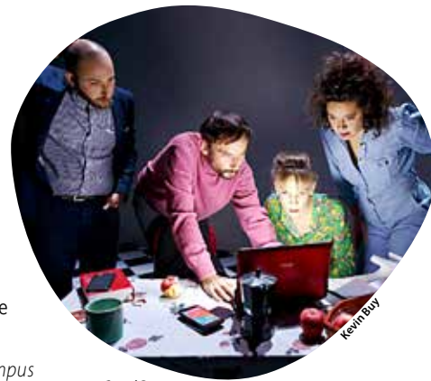
Grand Pays est à l'affiche, ce jeudi 17 octobre.

• Jeudi 17 octobre, 20 h, espace théâtre du Jardin de Verre