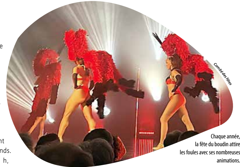
Comité des fêtes

Au programme : vente de boudins ce vendredi 18 octobre, à partir de 17 h et ce samedi 19 octobre, à partir de 9 h sur le parking d'Espace Émeraude. Pas moins de 12 recettes raviront les papilles des petits et des grands. Ce dimanche 20 octobre, dès 11 h, un marché de créateurs, où 30 exposants sont attendus (bijoux, gravures sur verre, etc.) viendra s'installer place de la Prairie. La journée sera aussi haute en festivités et en chansons avec un blind-test à 13 h, des animations pour les enfants (structures gonflables, maquillages, sculptures sur ballons, tours de poney...) dès 14 h, un spectacle de cabaret à 14 h 45,