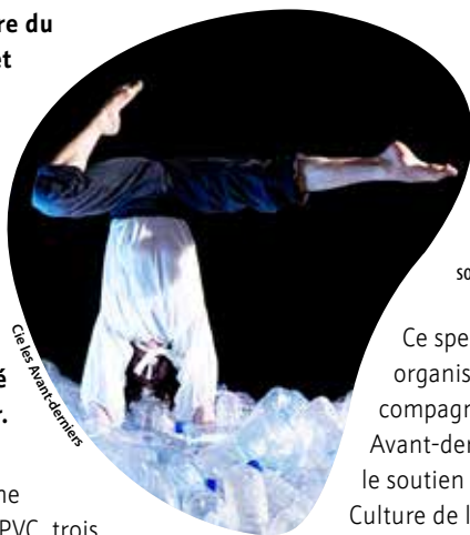
Ce May Avant-derniers

Au beau milieu d'une cathédrale de toile PVC, trois personnages évoluent dans un environnement incongru peuplé de bouteilles en plastique. Puisque la seule ressource matérielle présente est un déchet, c'est la ressource intellectuelle qui règne comme nouvelle monnaie sur cet îlot absurde : l'imagination, transformant plastiques en oiseaux et bouteilles en nuages. Au cœur de cette épopée fantasque, le cirque se mêle au clownesque dans un ballet décalé.