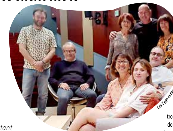
La troupe donne rendez-vous au public, pour une série de représentations de sa nouvelle comédie.

Réservation : Tél. : 09 60 50 82 52 Tarifs : 8 €, 5 € moins de 14 ans et étudiant