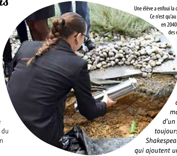
Une élève a enfoui la capsule temporelle. Ce n'est qu'au déterrement, en 2040, que l'ensemble des objets sera dévoilé...

Au chaud sous quelques centimètres de terre devant l'accueil de l'établissement, elle ne sortira que dans... 16 ans ! Une capsule temporelle a été enfouie, fin septembre, par 24 élèves de terminale Jeanne Delanoue. À l'intérieur : un téléphone portable, un masque chirurgical, un article sur la coupe du monde de football 2018, un crayon quatre couleurs, un scoubidou, un gilet jaune, un handspinner, une console de jeux vidéo, une attestation de sortie, un Malabar et son emblématique tatouage... : autant d'objets et souvenirs marquants, bons ou mauvais, pour cette génération. « Nous devons initialement mener un travail