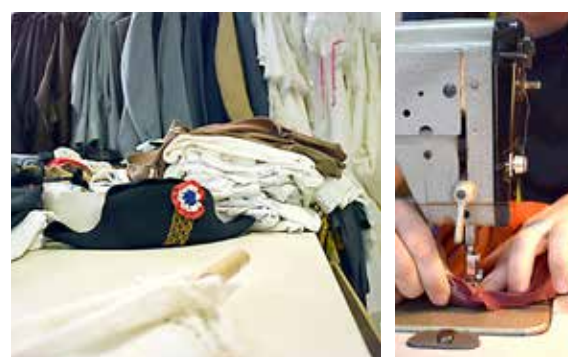
Une soixantaine de costumes sont confectionnés chaque année par l'association.

Cet anniversaire, c'est évidemment sur scène que l'association va le fêter, 70 ans après, jour pour jour. Lors d'une séance unique, le samedi 2 novembre prochain, à 14 h 30, Raconte-moi une histoire... L'Association d'éducation populaire retracera cette aventure exceptionnelle. Dans la foulée, l'Envers du décor ouvrira également ses portes pour faire découvrir sa collection de costumes.